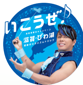
滋賀ふるさと観光大使 西川貴教

ちょっとうれしいおトク付き! 協力: 滋賀県・びわこビジターズビューロー ※詳しくは裏面をご覧ください。