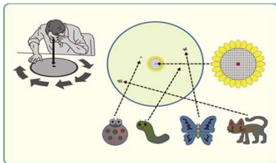
クロックチャート