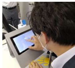
タブレット型視野計